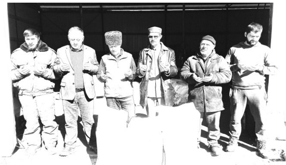
11 февраля отделение благотворительного фонда «Инсан» по Цахурской долине в селении Кина Рутульского района на базе дорожно-строительной

организации ООО «Дорстрой-К» провело акцию помощи.