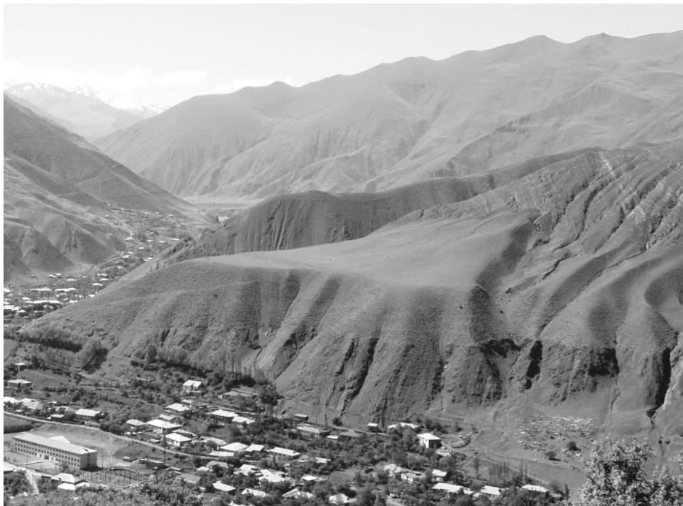
Географические координаты местечка «Хьымыды»: 41.537440, 47.428649, входит в состав Рутульского сельского поселения.